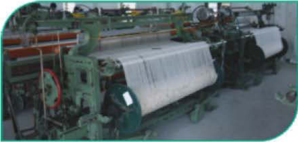
मायक्रो स्पिनींग व टेक्सटाईल प्रकल्प, डोंगरखंडाळा (बुलडाणा)