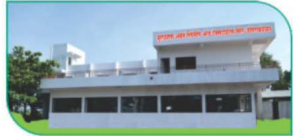
मायक्रो स्पिनींग व टेक्सटाईल प्रकल्प, डोंगरखंडाळा (बुलडाणा)