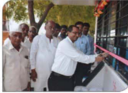
डोंगरखंडाळा (बुलडाणा) येथे पाण्याच्या ATM चे उद्घाटन