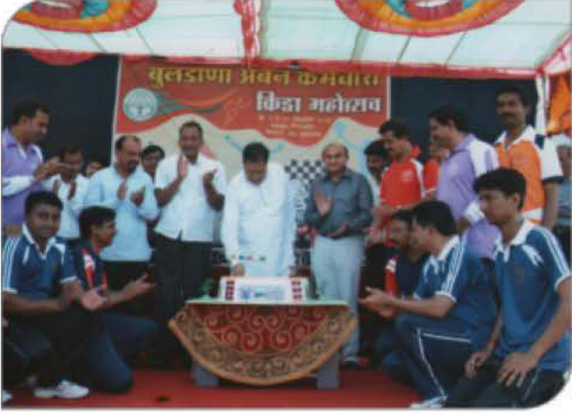
बुलडाणा अर्बन कर्मचारी क्रीडा महोत्सव २०१३ चे उद्घाटन करताना मा. भाईजी