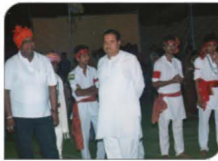
बुलडाणा अर्बन गरबा फेस्टिव्हल २०१३ या सांस्कृतिक महोत्सवात मा. भाईजी