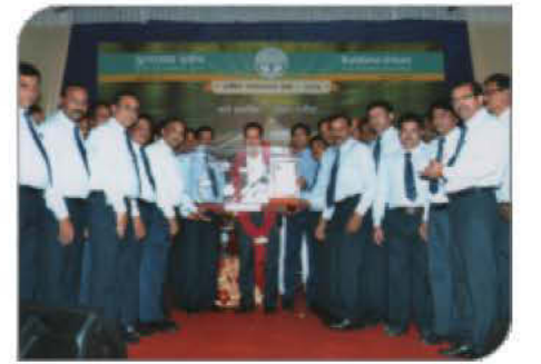
२०१३ च्या वार्षिक सर्वसाधारण सभेत मा. भाईजीचा सत्कार करताना सर्व विभागीय व्यवस्थापक