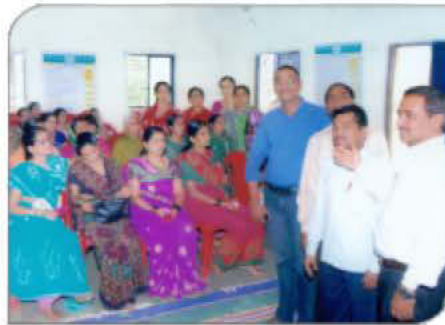
संस्थेच्या वतीने सुरु करण्यात आलेल्या महिला स्वयंसहाय्यता बचतगटाच्या सभेस मार्गदर्शन करताना संस्थेचे कर्मचारी