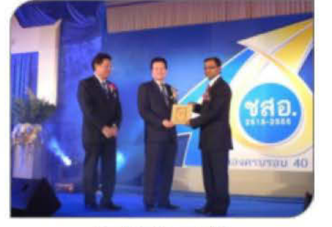
थायलंड फेडरेशनच्या वतीने बुलडाणा अर्बनचा सन्मान