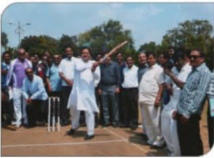
क्रीडा महोत्सवात मा. भाईजीचा मैत्रीपूर्ण फटका