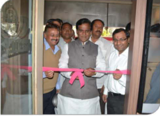
बुलडाणा अर्बनच्या वरुड शाखेचे उद्घाटन करताना केंद्रिय मंत्री मा. रावसाहेब दानवे