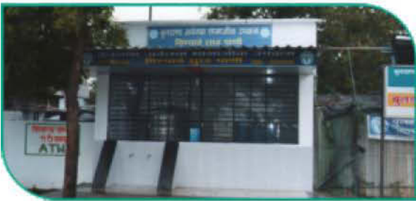
डोंगरखंडाळा (बुलडाणा) येथील पिण्याच्या पाण्याचे ATM