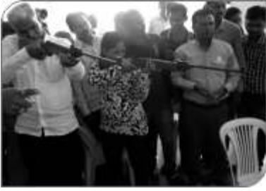
आंतरराष्ट्रीय नेमबाज तेजस्विनी सावंत कर्मचारी क्रीडा सप्ताहाच्या समारोपप्रसंगी