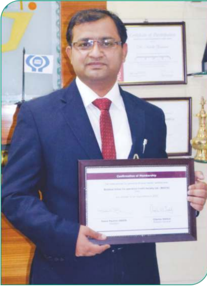
बुलडाणा अर्बनला आय.सी.ए. चे पूर्ण सभासदत्व मिळाले. भारतातील फक्त तीनच संस्थांना हा बहुमान मिळाला आहे. १) इफको, २) क्रिफको, ३) बुलडाणा अर्बन