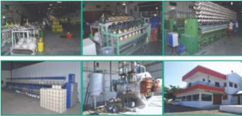
जगातील पहिली स्मॉल स्केल टेक्सटाईल्स मिल (डोंगरखंडाळा)