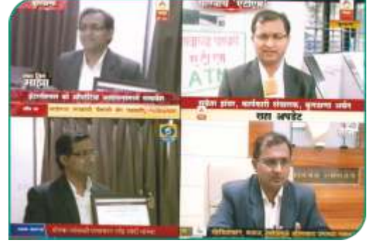
टी.व्ही. कव्हरेज बुलडाणा अर्बन