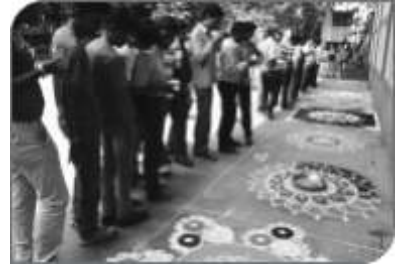
कर्मचारी क्रीडासप्ताहानिमित्त महिला कर्मचाऱ्यांनी काढलेल्या सुबक रांगोळ्या