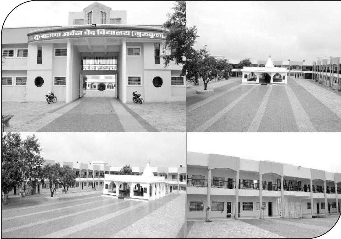
बुलडाणा अर्बन वेद विद्यालय व स्वर्गाश्रम, चिखली रोड, येळगांव (बुलडाणा)