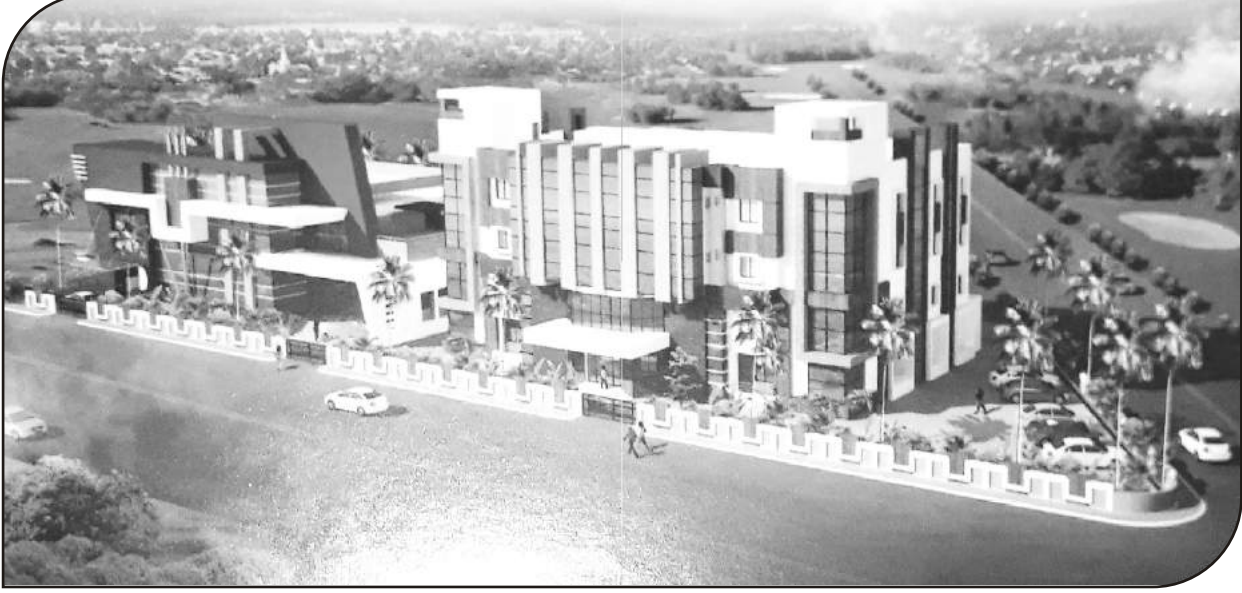
संस्थेचे शिर्डीयेथील सहकार प्रशिक्षण केंद्र व भक्तनिवास इमारत.