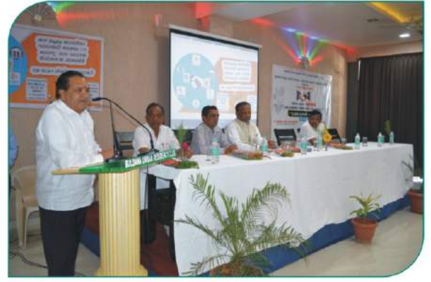
बुलडाणा येथील संपन्न झालेल्या कॅशलेस पतसंस्था कार्यशाळेत मार्गदर्शन करताना संस्थापक अध्यक्षा मा.श्री. भाईजी