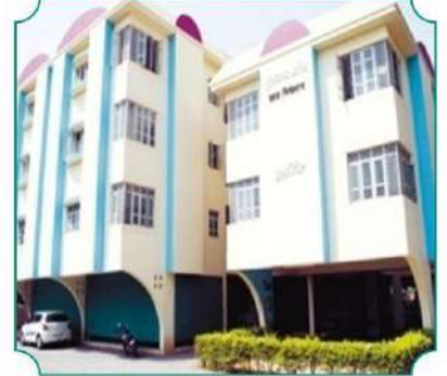
पुणे येथे हॉस्टेल