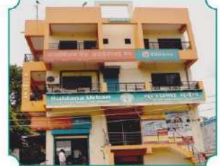
शाखा - चोपडा