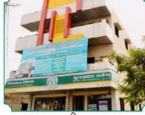
शाखा - महिला मलकापूर