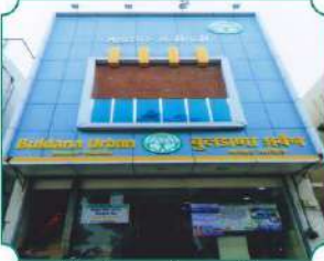
विभागीय कार्यालय, वाशिम