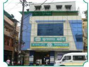
विभागीय कार्यालय, इंदौर