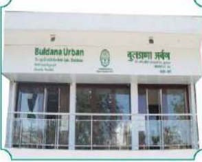
विभागीय कार्यालय, वर्धा