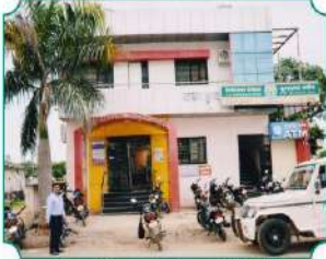
विभागीय कार्यालय, हिंगोली