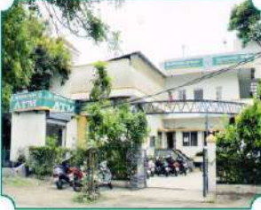
विभागीय कार्यालय, अकोला