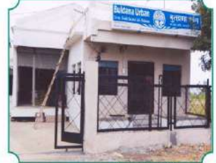
शाखा - मढ (जाळीचादेव)