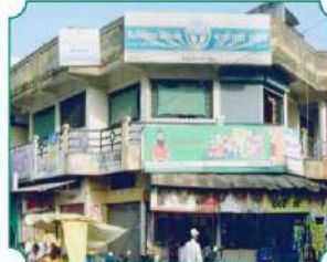
शाखा - कोढाळी