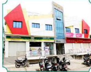
विभागीय कार्यालय, नांदेड