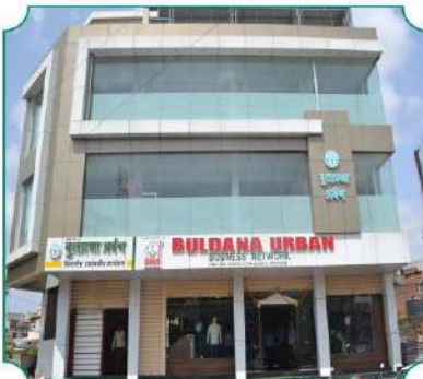
बुलडाणा अर्बन विस्तारीत प्रशासकीय कार्यालय आणि बुलडाणा अर्बन बिजनेस नेटवर्क, बुलडाणा