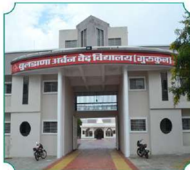
बुलडाणा अर्बन वेद विद्यालय आणि स्वर्गाश्रम, येळगांव