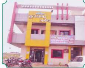
शाखा - बिबी