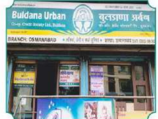
शाखा - उस्मानाबाद