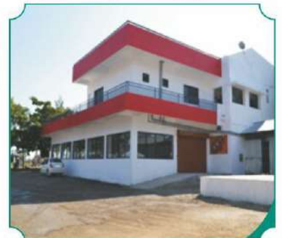
स्पिनिंग व टेक्सटाईल्स मिल, डोंगरखंडाळा ची इमारत