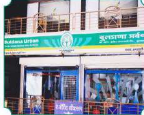
शाखा - अमरावती