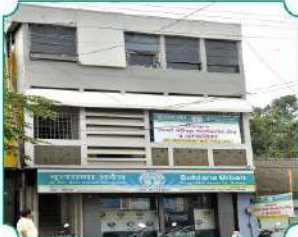
शाखा - गडहिंग्लज