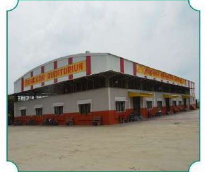
सहकार सांस्कृतिक सभागृह, बुलडाणा