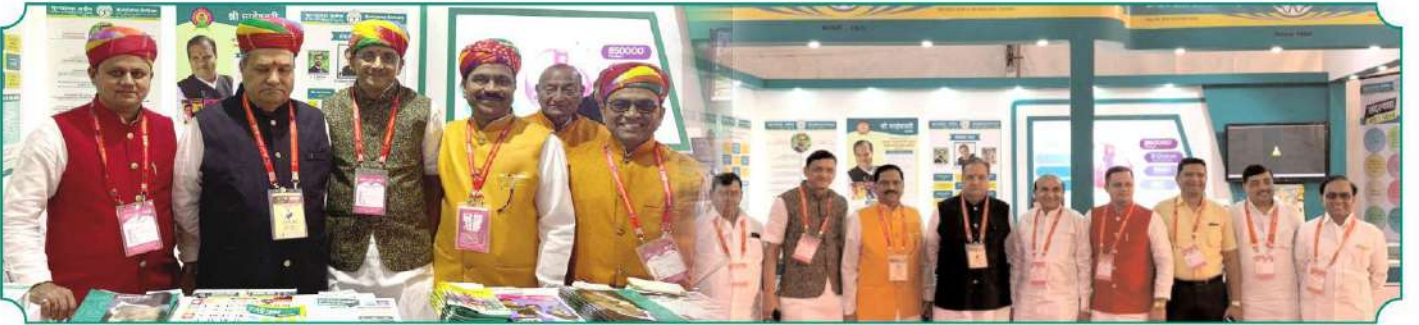
जोधपूर आंतरराष्ट्रीय माहेश्वरी महाअधिवेशनात बुलडाणा अर्बनच्या सहभागाचे कौतुक.