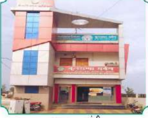
शाखा - उंद्री