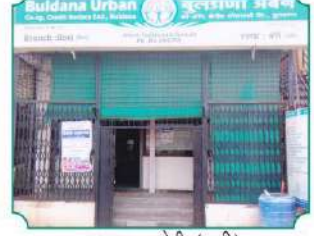
शाखा - बोरी (झरी)