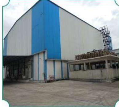
कोल्ड स्टोअरेज, एम.आय.डी.सी., चिखली