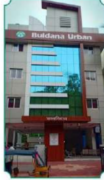
सह्याद्री - २ (तिरुपती)