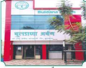
शाखा - औसा