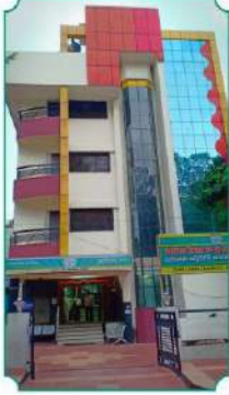
सह्याद्री - १ (तिरुपती)