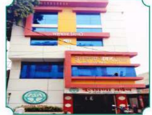
विभागीय कार्यालय, परभणी