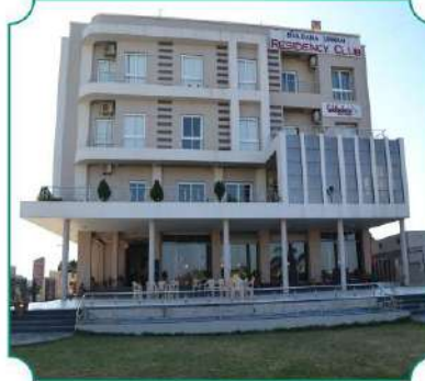
बुलडाणा अर्बन रेसीडेन्सी क्लब, बुलडाणा