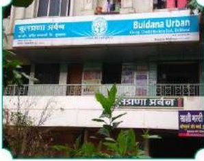
विभागीय कार्यालय, मलकापूर