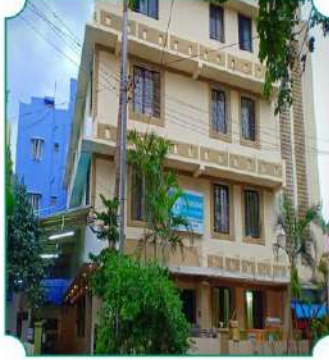
बजाज भक्तनिवास (तिरुपती)