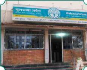
शाखा - कुरुदवाड