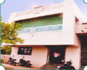
शाखा - रायपूर