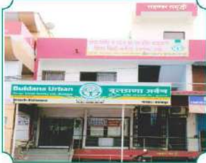
शाखा - बदनापूर