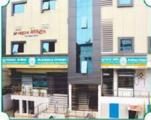
विभागीय कार्यालय, खामगांव