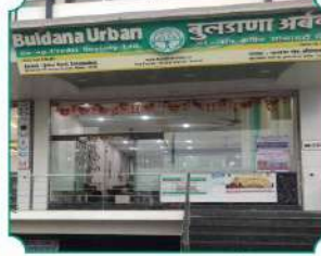
विभागीय कार्यालय, औरंगाबाद