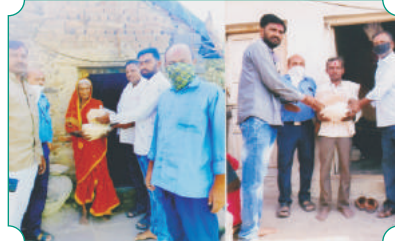
शाखा लोहा येथे कोरोना काळात मोलमजुरी करणाऱ्या गरजूंना अन्नधान्याची वाटप करताना शाखा लोहा चे कर्मचारी वृंद