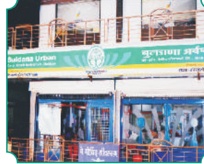
शाखा - अमरावती