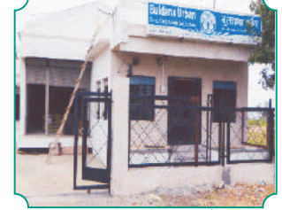
शाखा - मढ (जाळीचादेव)