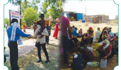
कोरोना काळात शाखा सिं.राजा व मेहकर येथून पायी जाणाऱ्यांना नास्ता,पिण्याचे शुध्द पाणी याचे वाटप करताना शाखा सिं.राजा व मेहकर चे कर्मचारी वृंद