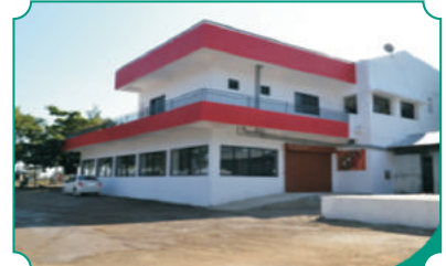
स्पिनींग व टेक्सटाईल्स मिल, डोंगरखंडाळा ची इमारत