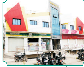
विभागीय कार्यालय, नांदेड