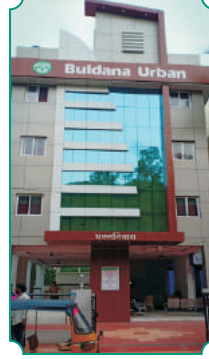
सह्याद्री - २ (तिरुपती)