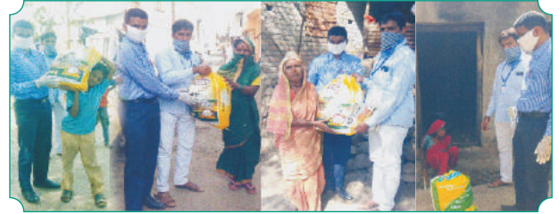
शाखा पालम (परभणी) येथील तहसिल कार्यालयामार्फत आलेल्या यादीप्रमाणे मजुर, कामगार, गरजू यांना अन्नधान्य व किराणा किटचे वितरण करताना शाखा पालम चे कर्मचारी वृंद