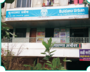
विभागीय कार्यालय, मलकापूर