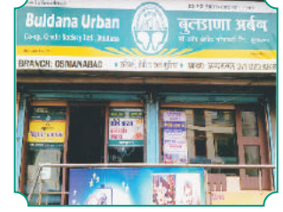
शाखा - उस्मानाबाद