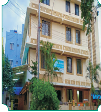
बजाज भक्तनिवास (तिरुपती)