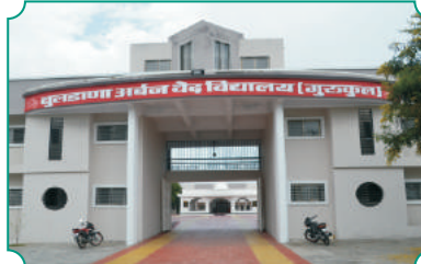
बुलडाणा अर्बन वेद विद्यालय आणि स्वर्गाश्रम, येळगांव