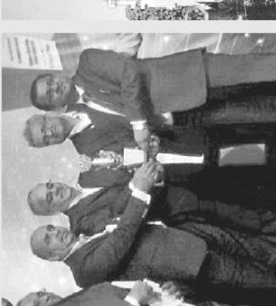
दि. १८ जून २०२० च्या दिव्य मराठी अंकातील 'आयकार्मिक ब्रॅन्ड ऑफ द इयर' या सदराखालील मुलाखत