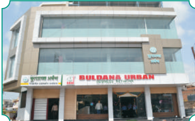
बुलडाणा अर्बन विस्तारीत प्रशासकीय कार्यालय आणि बुलडाणा अर्बन बिझनेस नेटवर्क, बुलडाणा