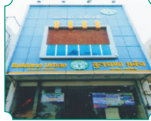
विभागीय कार्यालय, वाशिम