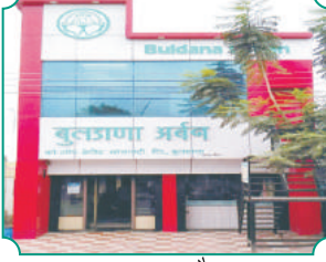
शाखा - औसा