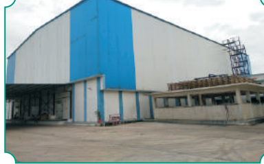
कोल्ड स्टोअरेज, एम.आय.डी.सी., चिखली