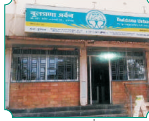
शाखा - कुरुंदवाड