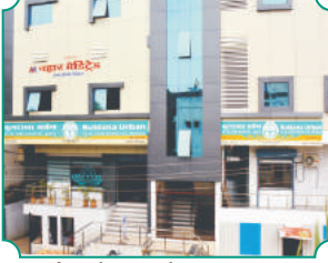
विभागीय कार्यालय, खामगांव