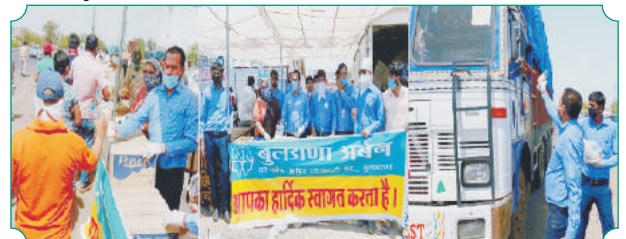
लॉकडाऊन काळात मुंबई, बंगाल, कोलकता येथून मध्यप्रदेश मध्ये पायी, अंटो, ट्रक, मेट्रोअर विविध वाहनाने आपल्या घरी परतणाऱ्या गरजू व्यक्तींसाठी शुध्द पाण्याच्या बॉटल, ओआरएस पाऊच, बिस्कीट पुडे यांचे वितरण करताना मध्यप्रदेश विभागातील शाखा इंदौर, राऊ, राजवाडा, उषानगर येथील कर्मचारी वृंद.