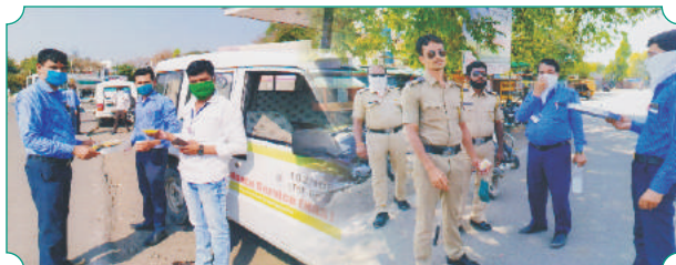
कोरोना काळातील कोरोना योद्धा पोलीस बांधव व आरोग्य कर्मचारी यांना पिण्याचे शुध्द पाणी, नास्ता, जेवण याचे वितरण करताना बिड विभागाचे विभागीय व्यवस्थापक व बिड शाखेचे कर्मचारी वृंद