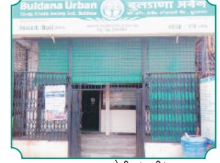
शाखा - बोरी (सरी)