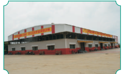
सहकार सांस्कृतिक सभागृह, बुलडाणा