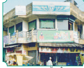
शाखा - कोढाळी