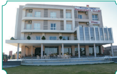
बुलडाणा अर्बन रेसीडेन्सी क्लब, बुलडाणा