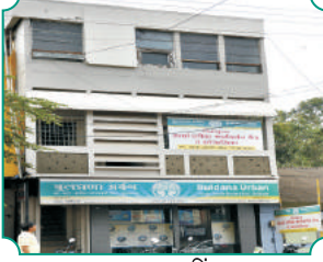
शाखा - गडहिल्लज