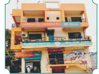
शाखा - चोपडा