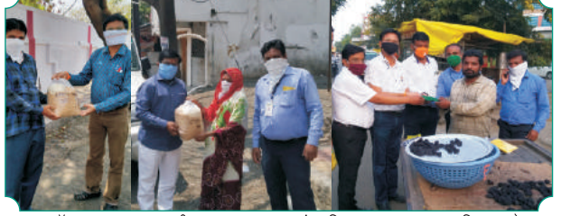
लॉकडाऊन काळात गरीब, मजुर कामगार यांना जिवानावश्यक वस्तु व किराणा चे वाटप करताना बुलडाणा ग्रामीण विभागाचे विभागीय व्यवस्थापक व शाखा बस स्टॅन्डचे कर्मचारी वृंद.