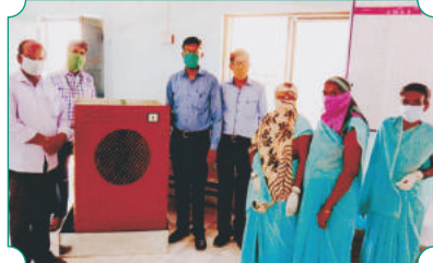
शाखा पिंपळगांव राजा येथील प्राथमिक आरोग्य केंद्राचे कोरोना योद्धा यांनी रनरनत्या उन्हात प्रत्येक रुग्णास अहोरात्र सेवा दिली त्याच्या मदतीसाठी संस्थेच्या वतीने डेअर्ट कुलर प्रदान करण्यात आले.