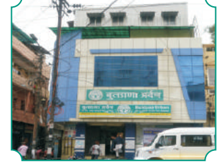
विभागीय कार्यालय, इंदौर