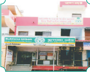
शाखा - बदनापूर