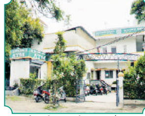
विभागीय कार्यालय, अकोला