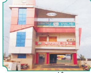
शाखा - उंद्री