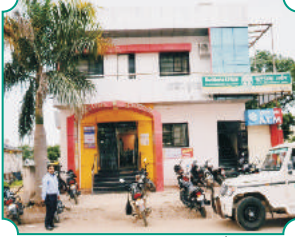
विभागीय कार्यालय, हिंगोली