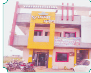
शाखा - बिबी