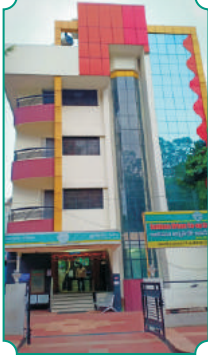
सह्याद्री - १ (तिरुपती)