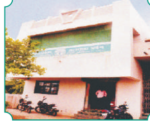
शाखा - रायपूर