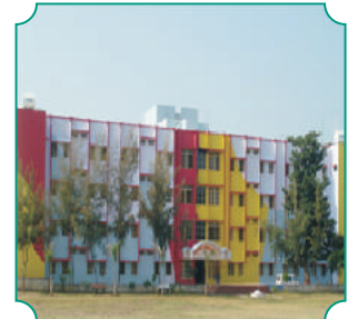
सहकार विद्या मंदिर व वस्तीगृह इमारत, बुलडाणा