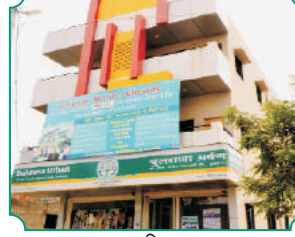
शाखा - महिला मलकापूर