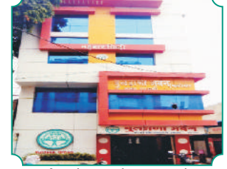
विभागीय कार्यालय, परभणी