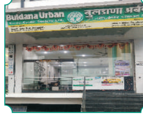
विभागीय कार्यालय, औरंगाबाद