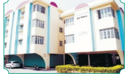
पुणे येथे हॉस्टेल