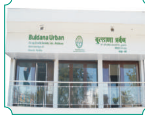
विभागीय कार्यालय, वर्धा